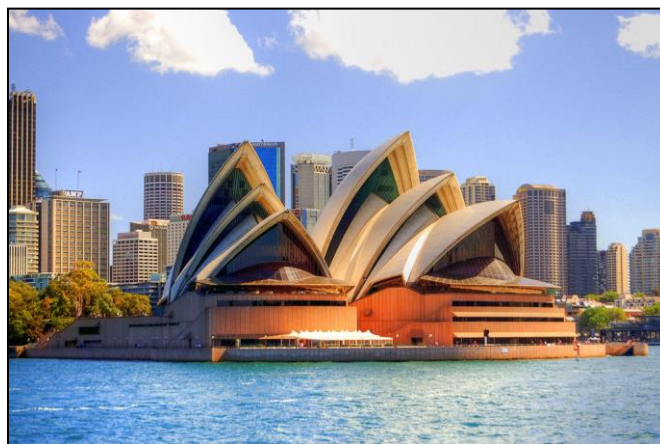
Оперный театр Австралия

Театр наполняет будни волшебством, позволяет окунуться в сказку, поэтому умейте ценить каждую минуту и радовать окружающих, так как это ежедневно делают люди, влюбленные в искусство длиною в жизнь!